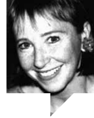
ان مک‌کلینتاک مترجم: هوشنگ راد لینک مطلب