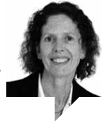
ال مک‌داول مترجم: پرتو فرهودی لینک مطلب