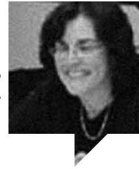
دبرا نورد مترجم: برکه امین اینک مطلب